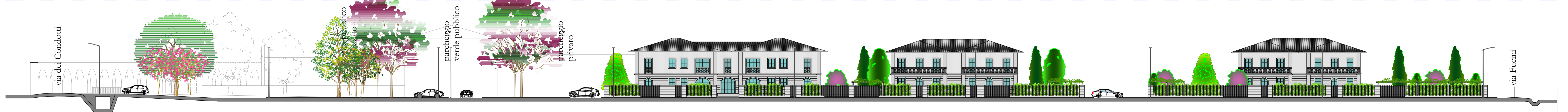
SEZIONE AMBIENTALE A-A' scala 1:200